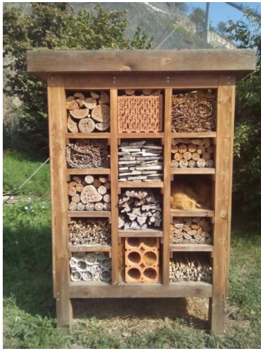
Hmyzí hotel v ZOO Praha v Tróji