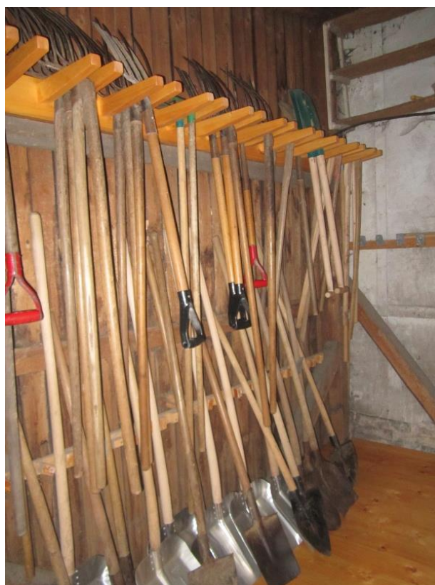
Úprava nářad'ovny – pracovní činnosti