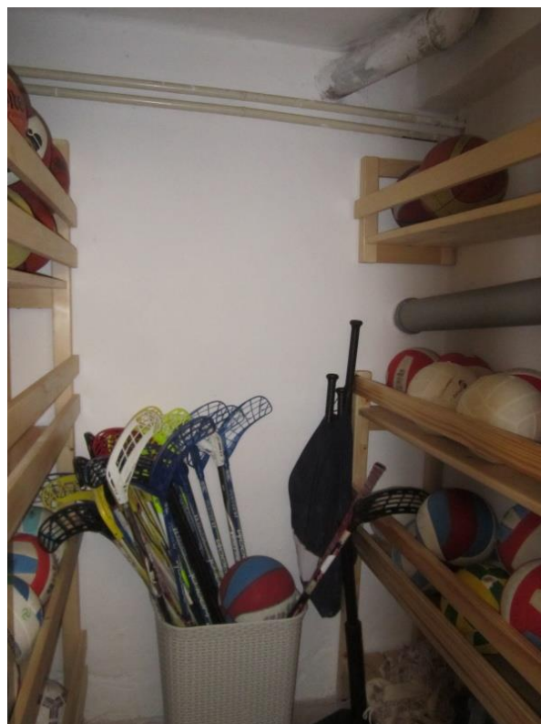
Regály v tělocvičně