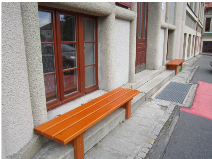
Lavičky před vchodem