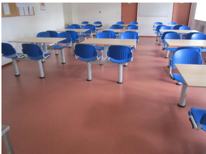
Podlaha v jídelně