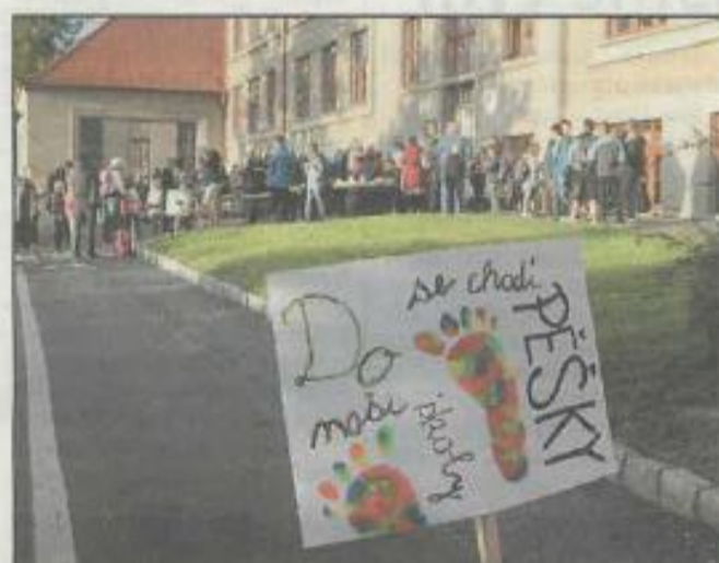
PRO svoji akci vyrobili školáci ve výtvarce i motivační transparenty.

Já si myslím, že u někoho ano. Určitě ne u všech, rozumím tomu, ale uvidíme. Bylo by to hezké, kdyby těch aut trochu ubylo.