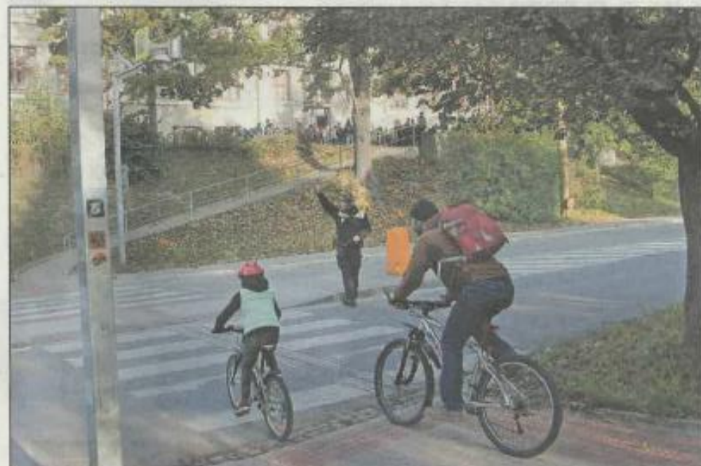
RODIČE přijíždějí s dětmi na kole do ZŠ Havlíčkova v rámci kampaně Pěšky do školy.