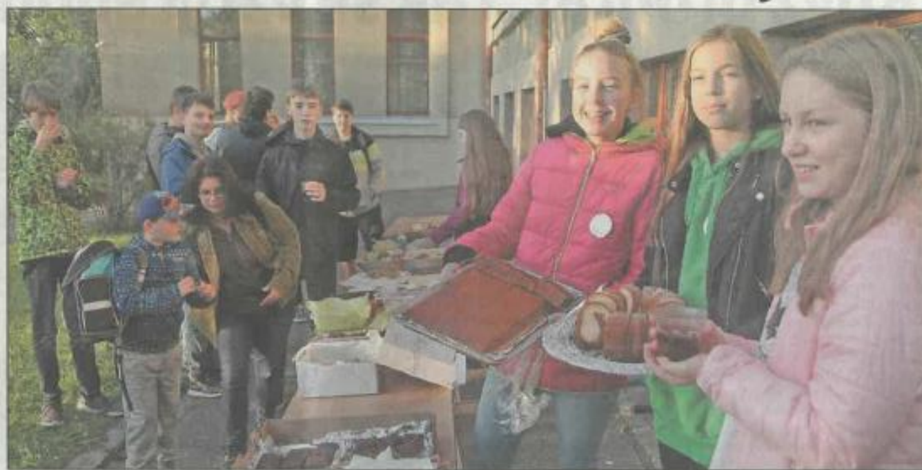
SPOLEČNÁ snídaně před budovou ZŠ Havlíčkova nahradila 19. září atmosférou společného prožitku tradiční ranní obrázek, kdy se tu střídá jedno auto za druhým.

Pozitivní reakce dětí nás až míle překvapila, protože jsme se báli, že malé děti budou chtít dojet autem, jak jsou zvyklé, až těsně do prostoru před sko-