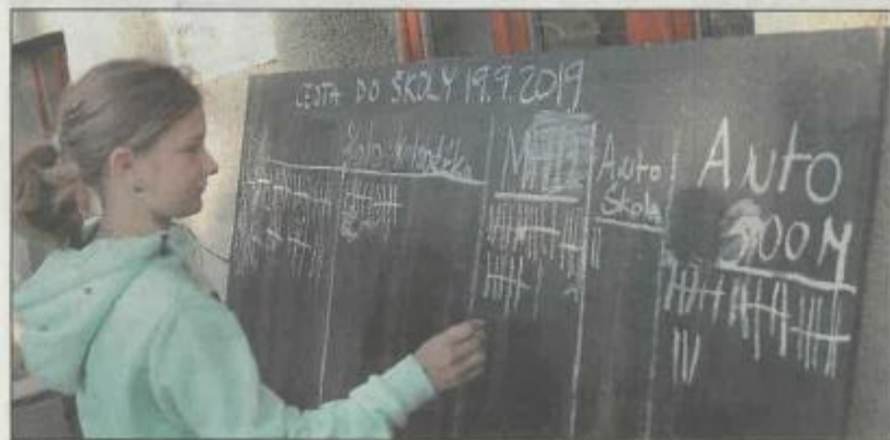
PRO STATISTIKU posloužila klasická tabule a křída.